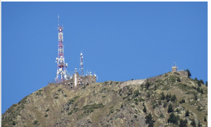
Der Hauptsendestandort vom aktuellen RTVA-Andorra für FM/TV