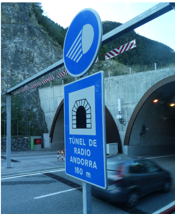
Ein Straßen Tunnel neben dem Sendebäude wurde nach dem Radio Andorra benannt

und im Facebook unter „EDXC“ leicht zu finden.