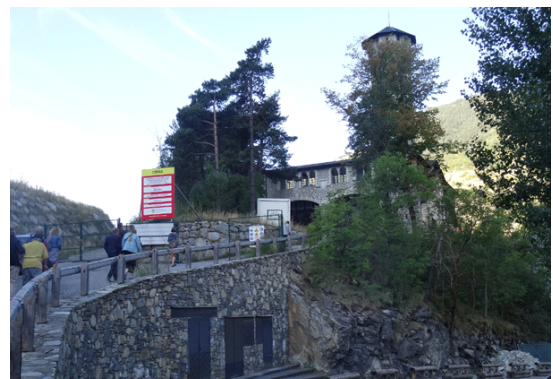
Auf dem Weg zum Sendebäude vom ehemaligen Radio Andorra – Zur Zeit eine Restaurationsbaustelle