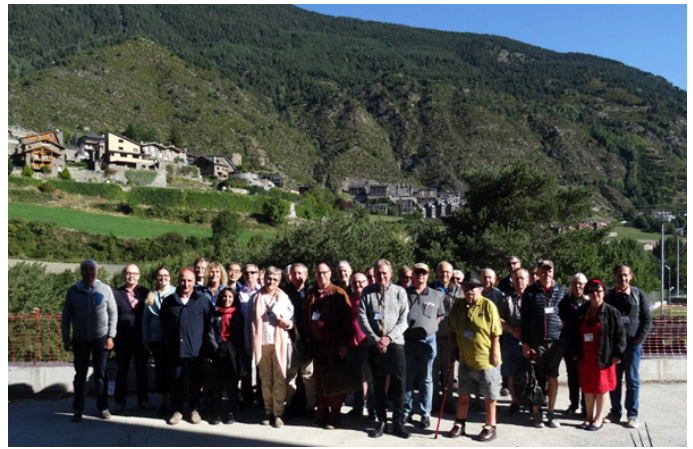
EDXC-Gruppe vor dem Radio Andorra Sendebäude