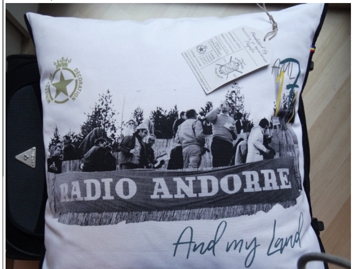
Eine Textilmanufaktur in Andorra hat diesen schönen Polster gestaltet mit „Radio Andorre“